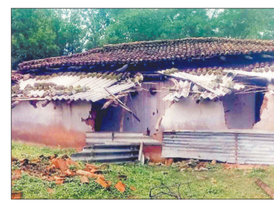
हाथियों द्वारा क्षतिग्रस्त घर।