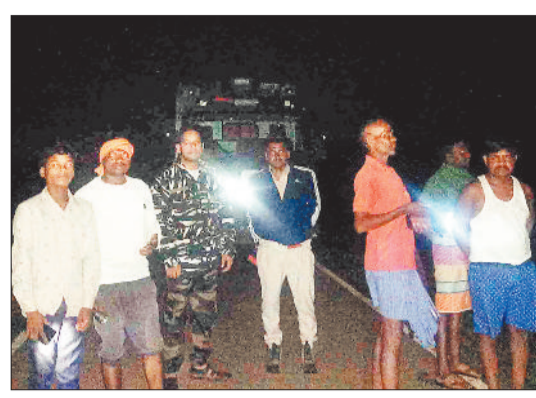
रात में हाथियों की निगरानी करते वनकर्मी एवं ग्रामीण।

एक सप्ताह के भीतर हाथियों ने अलग-अलग गांवों में 10 से अधिक मकानों को ध्वस्त कर खण्डहर बना दिया है। हाथियों ने कुछ घरों के दीवार को तोड़ा है जबकि कुछ घरों में रखे अनाज को खाने के लिए सुरंग बनाया है वहीं कुछ घरों को ध्वस्त कर खण्डहर बना दिया है। अरी बरसात में घरों के खण्डहर बनने के कारण प्रमावित परिवारों के समक्ष तिर छिपाने का संकेत उत्पन्न हो गया है। अलग-अलग दलों में बंटकर पहाड़ी क्षेत्र, तराई क्षेत्र एवं समतल इलाके की बस्तियों में पहुंच जा रहे हैं जिसके कारण वन अमले को भी निगरानी के लिए कड़ी मशकत करनी पड़ रही है। एक सप्ताह से लगातार पूरी रात हाथियों की निगरानी करने के कारण वनकर्मियों के स्वास्थ्य पर विपरीत प्रभाव पड़ रहा है।