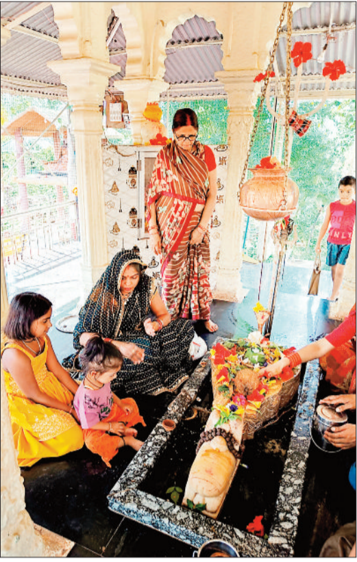
हरिभूमि न्यूज | बैकुंठपुर

सावन माह के पहले सोमवार 14 जुलाई को शहर समेत जिलेभर के शिवालियों में श्रद्धालुओं की अपार भीड़ उमड़ी रही। अलसुबह से ही शिवभक्त पूजा-सामग्री के साथ भोलेनाथ के दर्शन और जलाभिषेक के लिए मंदिरों की ओर निकले। शहर के प्रसिद्ध प्रेमाबाग शिव मंदिर में सुबह होते ही श्रद्धालुओं का तांता लग गया। विधि-विधान से भक्तों ने बेलपत्र, जल, दूध, धतूरा, भस्म और पुष्प आदि अर्पित कर भगवान शिव की आराधना की। सावन के पहले सोमवार को कई शिव मंदिरों में महिला श्रद्धालुओं ने भजन-कीर्तन का आयोजन कर माहौल को और भी आध्यात्मिक बना दिया। मंदिरों में बोल बम, भोले शंकर जैसे जयकारे दिनभर गूंजते रहे।