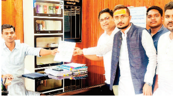
एसपी को ज्ञापन सौंपते कांग्रेस नेता