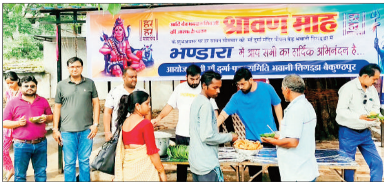
भवानी तिगड़ा में आयोजित भंडारा।